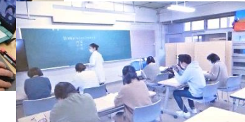
教材としてオリジナル動画も

ができ、参加者それぞれが「参加している」と実感できる内容で、最後まで飽きさせない新しい時代の研修の姿を感じることができました。