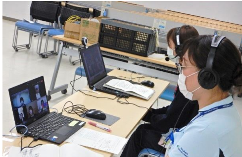
部署から10名の若手看護師が参加

3月1日（水）、就職活動前の本学の看護学科3年生対象に、若手看護師との交流会を行いました。昨年同様新型コロナウイルスの感染予防対策として今年度は Teams を用いたリモートでの開催となり、17名の参加がありました。新人の教育体制などについて説明を聞いた後、第1希望とそれ以外の2つの部署の看護師と40分程度の交流を行いました。最初は学生たちも緊張した様子でしたが、だんだんと打ち解けた様子が見られ、気になる点を質問していました。「年の近い看護師さんに実習中には聞けなかったたくさんのお話を聞いてよかったです。」という学生からの感想が聞かれました。この交流会をきっかけに1人でも多くの学生に就職先として奈良医大附属病院に関心を持ってもらえればと思います。