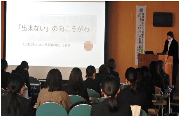
価値を提供するとは…

先生はいろいろなケースで自分ならどのように対応するのか学生に問いかけていました。看護師が様々な課題を乗り越えて、患者やその家族だけでなく自分も前向きになっていく物語も紹介されました。