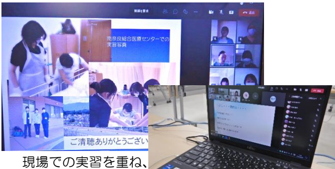
現場での実習を重ね、身につけたものを自らの言葉で報告されました

研修で得た知識をいかに自分のものにしていったか、実習での問題点をどう克服していったかなど、それぞれが学んだ内容を5分程度で発表しましたが、その後の質疑応答は非常に活発なもので、研修への関心の高さがうかがえました。