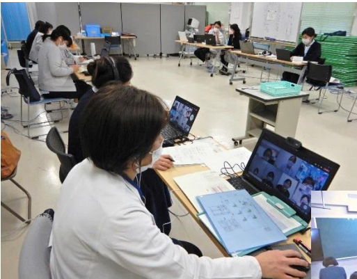
オンライン上でグループワーク

1月7日(金)に、今年度の上級臨床指導者育成プログラム受講者の企画・運営で実習指導者・看護学科教員合同研修を Teams で開催し、45名が参加しました。