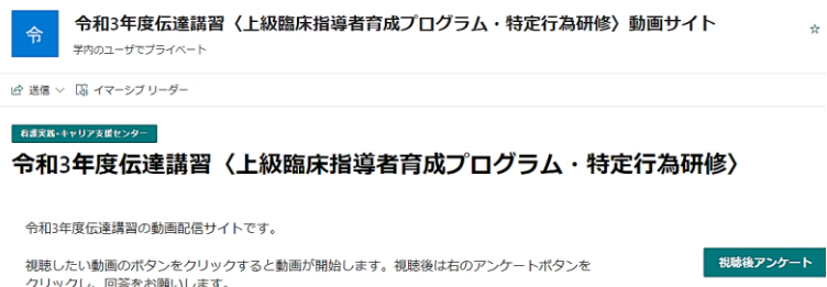
Sharepoint を利用した初の伝達講習

3月4日～31日、院内看護職者を対象に上級臨床指導者育成プログラム受講者と院内の特定行為研修受講者の伝達講習を学内 Sharepoint にアップロードする形で実施しました。1年の研修で得た学びを1人約5分の動画にまとめたものが、パソコンやスマートフォンから視聴できます。視聴後のアンケートより、特定行為研修について「看護の視点を生かした看護師の役割拡大について述べられていて勉強になりました。」という意見が寄せられています。視聴した方がこの研修に興味をもっていただければと思います。