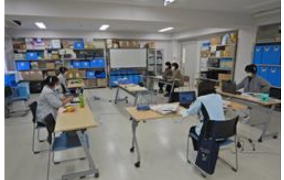
子育てしながらの働き方を伝える

リモート開催のため、遠方からも気軽に参加できるというメリットもあることが分かり、今後の開催方法についても再検討していきたいと思います。