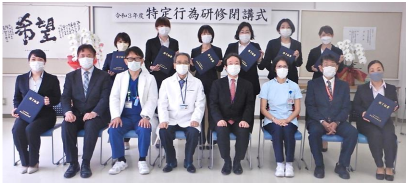
閉講式参加の修了生と研修でお世話になった方々