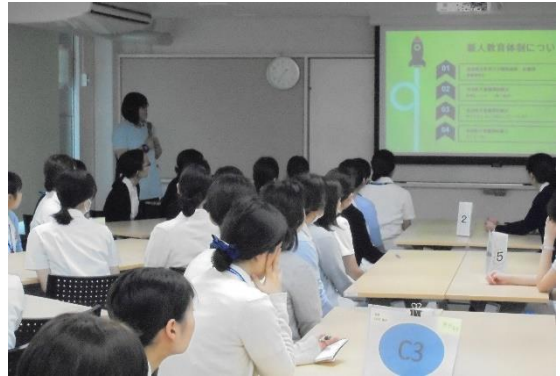
手厚い看護教育システムを紹介

この研修は初めての企画でしたが、就職活動に向けて非常に参考になったことや、奈良医大の魅力を改めて知るきっかけになったようです。「奈良医大に就職したいです！」と言ってくれた学生もいました。