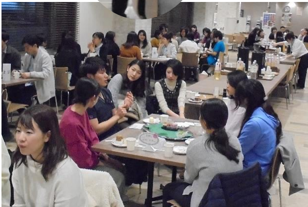
気になる部署の先輩ナースの話を聞く学生たち