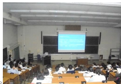
研修の成果を報告

3月19日(火)、看護師特定行為修了生と今年度の上級指導者育成プログラムの受講生による報告会が開催され、看護部から70名が参加しました。特定行為研修については、急性期コース48%、在宅コース53%が研修内容に興味があると答え、院内にも徐々に周知されてきていることがわかります。上級臨床指導者育成プログラムの修了報告では看護基礎教育から臨床実習をつなぐ役割についてや、今後上級臨床指導者として実習指導者をサポートしながら学習者を巻き込む環境作りが必要であること等、多くの学びを発表されました。特定看護師、上級臨床指導者共に臨床でのご活躍を期待しています。