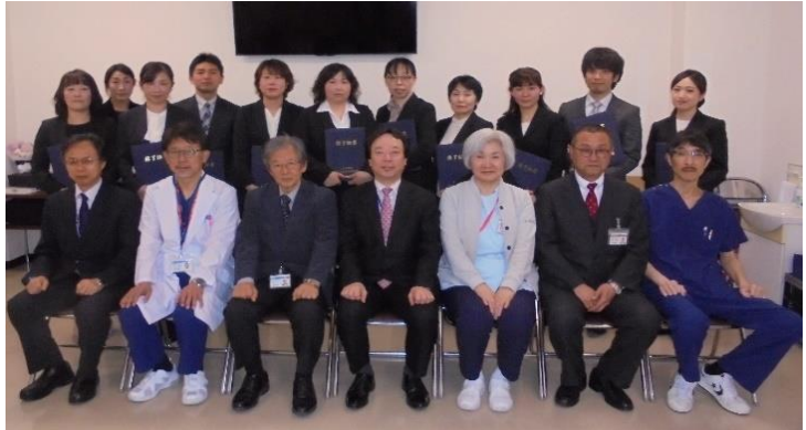
今年度修了生と研修でお世話になった方々

約半年の机上学習後に急性期コースは院内で、在宅コースは県内11施設で実習を行い、それぞれ苦勞しながらも乗り越えることができました。閉講式では、修了生から実習に同意をしてくださった患者様、研修中ご指導いただいた先生方、研修への参加に協力してくれた自部署のスタッフへの感謝の言葉が多く聞かれました。修了生がそれぞれの思いを胸に、働き方も含め多くの課題に取り組む姿を温かく見守り、今後のご活躍を期待したいと思います。