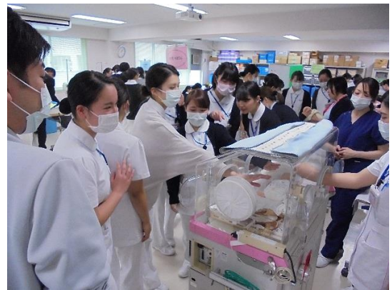
新人教育の一部を体験