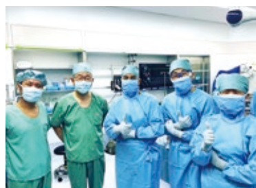
奈良県立医科大学の手術室にて